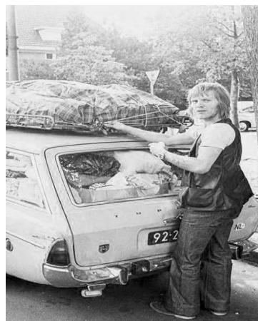
Op Vakantie in vroegere tijden